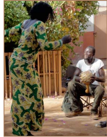
La doyenne de la troupe des Diabaté qui anime magnifiquement chaque manifestation Polemde de leurs danses et musiques traditionnelles.