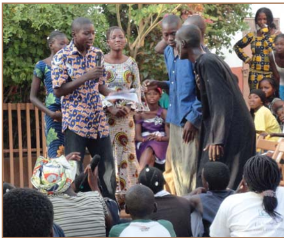
La pièce sur les inondations traitait des relations socio-culturelles entre les familles sinistrées. Quels échanges !