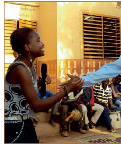
Un des pièces de théâtre abordait le thème des couples et des mensonges !

Les voyages des marraines et des parrains venus à Ouagadougou au cours de l'année scolaire 2009-2010 :