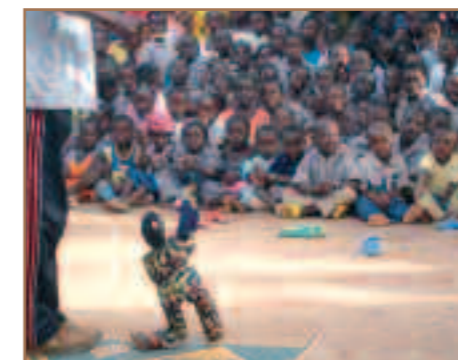
L'intervention du marionnettiste fut un cadeau de dernière minute fort apprécié par tous les âges.