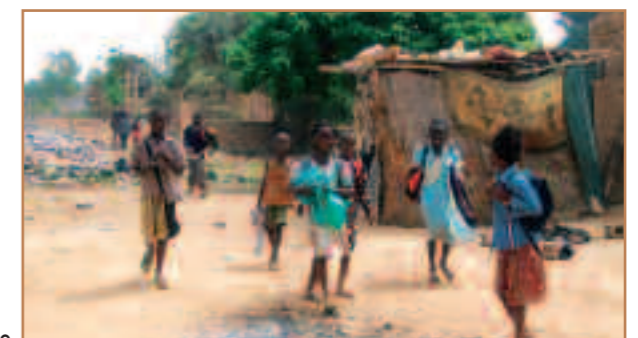
Les enfants au retour de l'école.

Marraines, parrains, ne l'oubliez pas, nous réinscrivons votre filleu(lle) au mois de juillet!