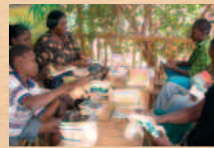
Grand nettoyage de tous les livres avec l'aide des enfants en février.