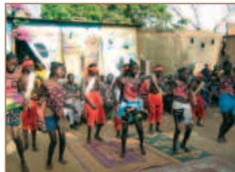
Le ballet traditionnel des "Hirondelles blanches" s'est enrichi de tourtereaux cette année.