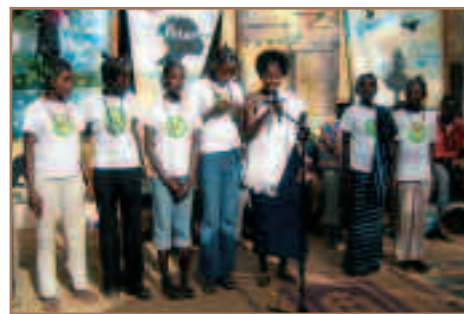
La chanson en remerciement à Polemdé fut un moment très émouvant.

Ces moments de fêtes sont une bouffée de bonheur pour tous et leur souvenir reste inscrit dans la mémoire de la grande famille Polemdé-destinée