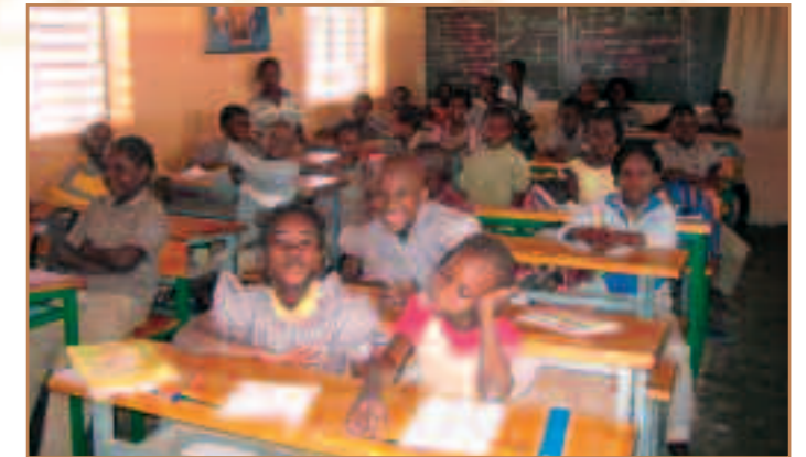
La classe de CE1 à l'école catholique de Dapoya.