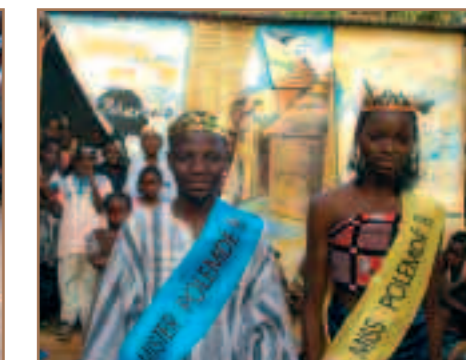
Miss et Mister Polemdé ont brillé par leur élégante prestation et quelle fierté !