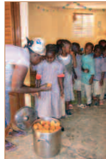
L'heure du goûter à la maternelle.