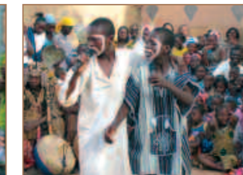
Une scène de la pièce de théâtre écrite et mise en scène par les enfants.