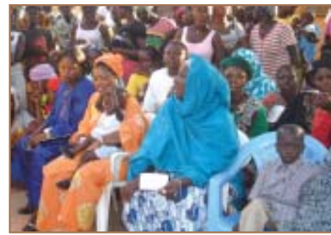
Les parents et même les plus petits étaient présents.