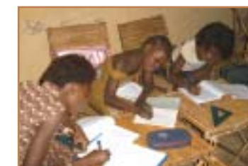
Révisions en vue de l'examen blanc.

L'apprentissage d'un métier sera pour les grands en difficulté scolaire une alternative que nous souhaitons développer. Les possibilités de formations abordables ne sont cependant pas nombreuses.