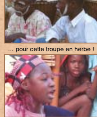
... pour cette troupe en herbe !