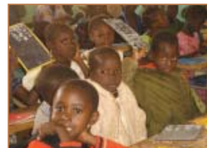
Plein feu cette année sur les 12 CP1 qui n'ont pas démerité.