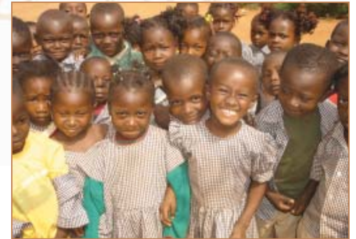
12 petits maternelles vont prendre l'année prochaine le chemin de la grande école. De nouvelles aventures à suivre...

Malgré les difficultés rencontrées par certains, chaque année quelques enfants finissent par prendre leur envol.