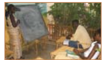
Un nouveau professeur pour l'encadrement des 4 èmes en physique-chimie.