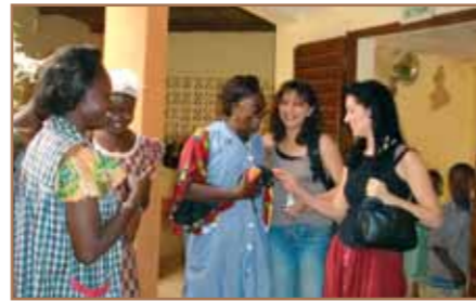
A la maternelle

Beaucoup d'émotions et une belle histoire qui se renforce entre Chapi-Chapo et Polemdé.