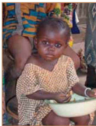
Une future Polemde ?