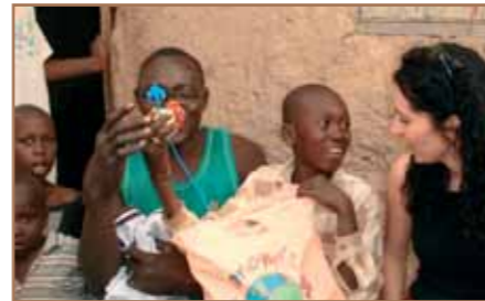
Le regard de Baba en dit long...