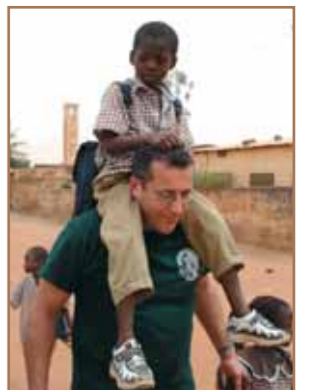
Et retour de l'école en grande compagnie.