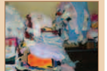
Un tout petit échantillon des vêtements pour bébés.

● En novembre, une grande distribution de vêtements a eu lieu sur plusieurs jours. Elle a profité à tout le quartier, des bébés aux adultes. La prochaine aura lieu en mars.