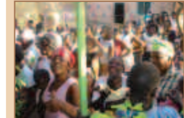
Affluence à la porte de la bibliothèque! Il y en aura pour tout le monde...

Parmi les dons reçus des particuliers, cette chaise roulante a fait le bonheur d'un ami handicapé du quartier.