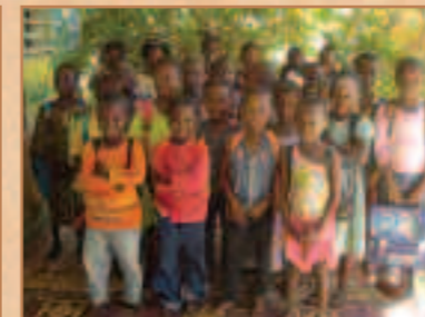
CP1 et CP2 presque au complet après les distributions de fournitures et cartables.