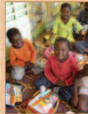
Distribution pour les CP1.

Plus de 50 enfants cette année en dehors des parrainages ont reçu fournitures, cartables et livres scolaires. Nous les entourons et leur apportons motivations et encouragements comme avec les enfants parrainés. Beaucoup deviennent très proches et nous apportent régulièrement leurs résultats scolaires. Ils se sentent intégrés à Polemde, ils sont très heureux et très motivés.