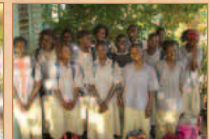
14 des 19 secondaires après la distribution des tenues scolaires.