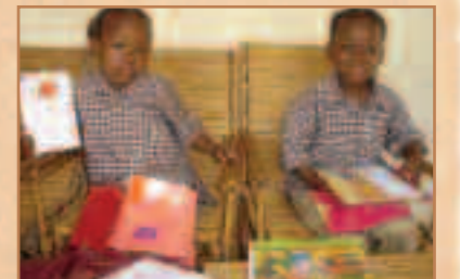
Les jumelles reçoivent lettres et cadeaux de leurs marraines respectives qui n'oublent jamais la sœur.