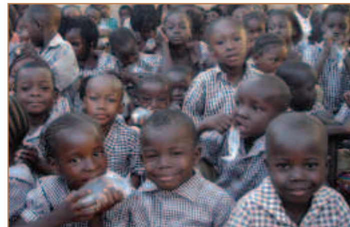
Tous les enfants en tenue scolaire le jour de la réunion.

Cette réunion est essentielle et cette année les parents y ont participé activement par leurs interventions et leurs propositions. Ils ont d'ailleurs créé une APE (Association des parents d'élèves) Polemde qui montre leur désir de s'investir.