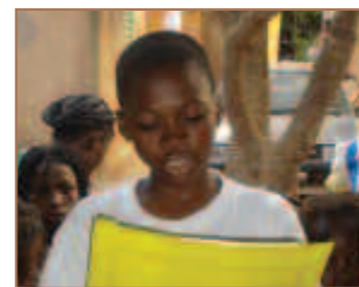
Les enfants primés reçoivent tous un diplôme, un magnifique stylo (merci à l'AIPB) et lisent leurs écrits à tous les autres. Applaudissements de l'assemblée et fierté des petits écrivains en herbe...