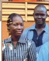
Deux de nos élèves de terminale.