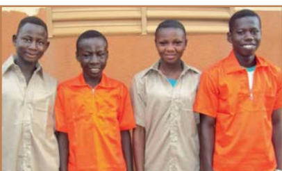
Élèves en 1 er cycle technique.

La réussite de cette belle rentrée est le fruit de nombreux échanges entre la France et le Burkina. Mission accomplie !