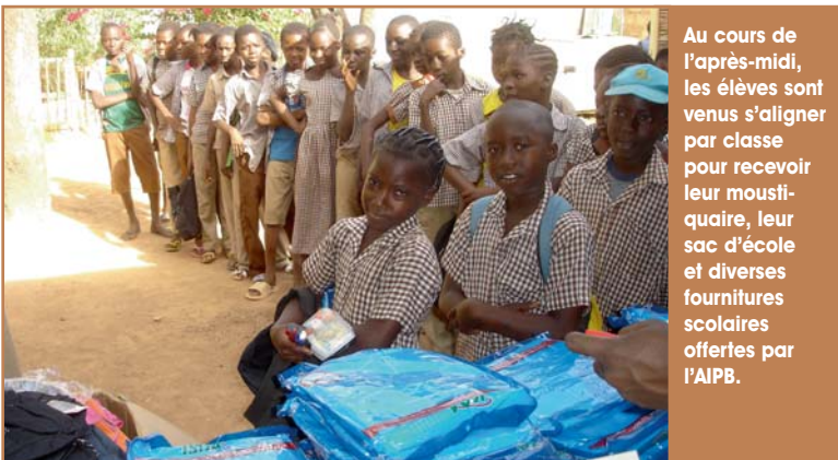
Au cours de l'après-midi, les élèves sont venus s'aligner par classe pour recevoir leur moustiquaire, leur sac d'école et diverses fournitures scolaires offertes par l'AIPB.

C'est en février 2015 que nous avons procédé à ces distributions grâce aux dons financiers et matériels apportés par la fondation Sodébo en 2014. Le container ayant eu un grand retard, les élèves n'avaient pu profiter à la rentrée 2014-2015 des nombreux sacs d'école collectés au sein de l'entreprise Sodébo que nous remercions.