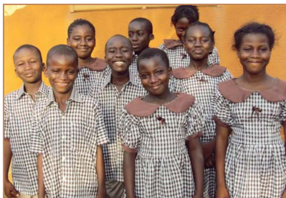
Élèves de primaire avec leurs nouvelles tenues scolaires.