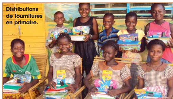
Distributions de fournitures en primaire.