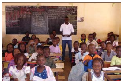
La classe de CP2.