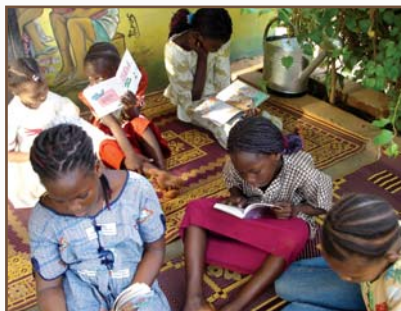
Les enfants en pleine lecture à la biblio.

Notre belle bibliothèque connaît une fréquentation de plus en plus importante, 115 enfants inscrits!! Une nouvelle terrasse abritée a été construite pour les recevoir tous. Aujourd'hui, ils ont vraiment le goût de la lecture et se pressent chaque jeudi et samedi pour lire et échanger entre eux. Régulièrement nous alternons des après-midi d'animations telles que dessins, discussions, chants et récitations. À la Foire Internationale du Livre de Ouagadougou (novembre), nous avons pu acheter de nombreux contes africains illustrés qui enrichissent nos étagères. 37 enfants inscrits à la biblio ont été conviés à cette Foire du Livre et ont assisté à un spectacle animé par des conteurs, des musiciens traditionnels et des danseurs. Les enfants ont qualifié ce moment de : « merveilleux! » ou bien « c'est le paradis! ».