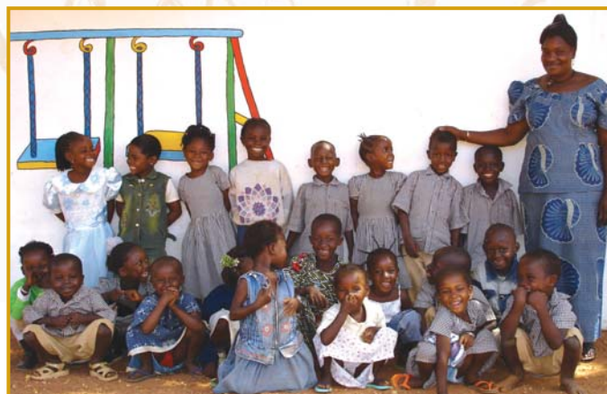
Les maternelles et leur directrice.

En dehors de ces parrainages, 9 enfants du quartier ont pu être aidés par l'association pour leurs livres et fournitures.