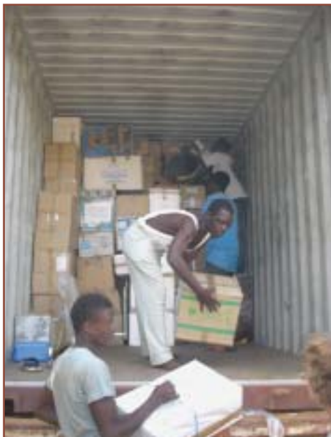
Déchargement du container.

Le déchargement du container s'effectue sous la surveillance et le pointage de la Présidente de l'Association. Plus de 3 heures pour récupérer l'ensemble des colis de ce double container. Quatre amis du quartier, deux enfants de l'Association, le responsable aux scolarisations et le chauffeur étaient présents.