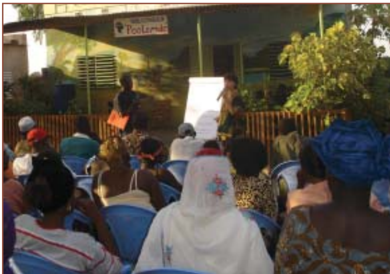
La réunion annuelle de Polemdé réunissant tous les parents et les enfants.