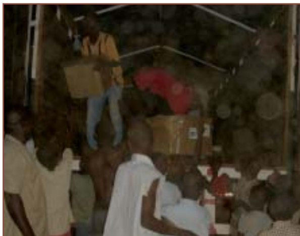
Tout le monde est présent pour aider au déchargement des colis au siège de l'association.