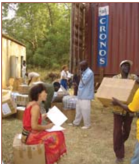
Pointage du colisage