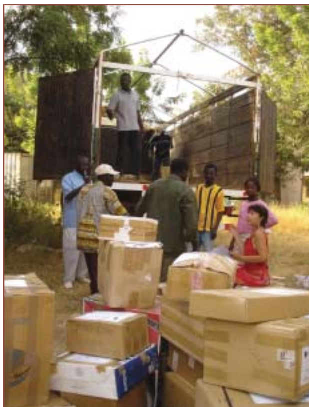
et rechargement dans le camion loué à Ouaga.