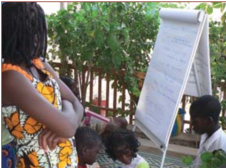
Sur la terrasse de la biblio, panneau d'infos.