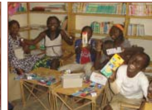
Les secondaires, 6 ème et 5 ème